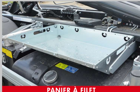
PANIER À FILET