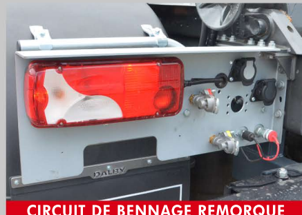
CIRCUIT DE BENNAGE REMORQUE