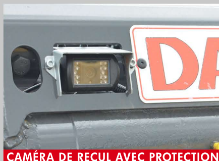
CAMÉRA DE REÇUL AVEC PROTECTION