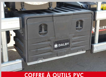
COFFRE À OUTILS PVC