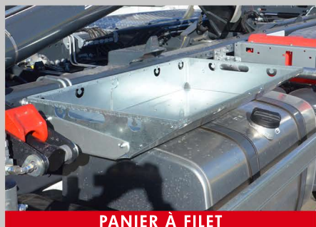
PANIER À FILET